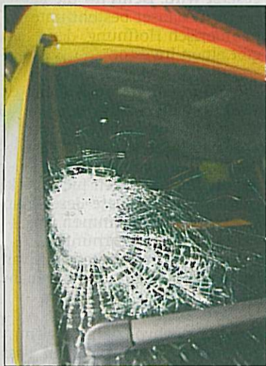
Die zerstörte Frontscheibe des Rettungswagens.

Die Polizei hat zwei Verdächtige gestellt – einen 17-Jährigen (0,28 Promille Alkohol) und einen 22-Jährigen (1,44 Promille). Nach dem dritten wird gefahndet. Die Polizei ermittelt wegen gefährlichen Eingriffs in den Straßenverkehr. (lex)